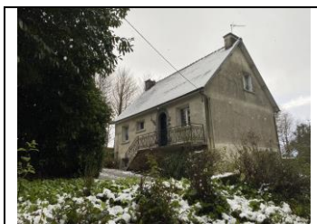
Photo générale de l'immeuble

La mission consiste à faire un examen le plus complet possible de la situation de l'immeuble ou de l'ouvrage désigné par le client sur le contrat de mission vis à vis des agents de dégradation biologiques du bois